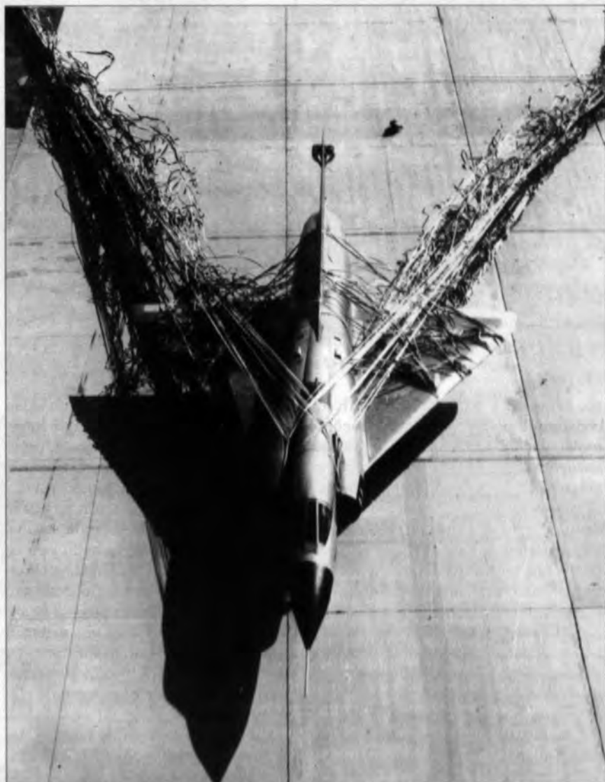
Enganche con red de un avión frenado.

La expresión de determinados genes da lugar a la síntesis de enzimas o proteínas que, directa o indirectamente, están ligadas a una actividad enzimática que implica la producción de ciertos metabolitos. Así, pues, las