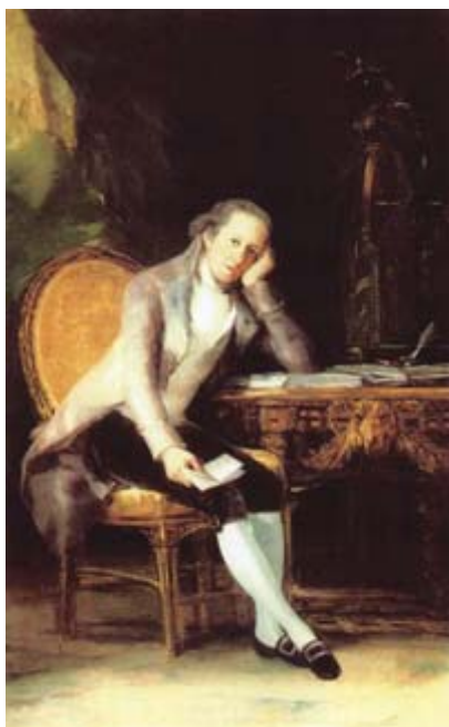
FIGURA 13. Jovellanos, por Goya.

do VII, a causa de sus ideas). No cabe duda que éstos, al igual que otros muchos (frecuentemente anónimos), fueron los auténticos patriotas .