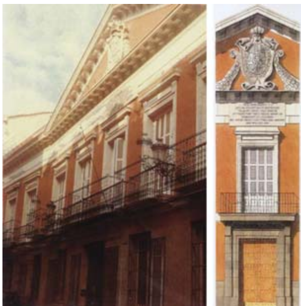
FIGURA 1. Reinando Fernando VII, en 1830, fue erigido este edificio para la enseñanza de los estudios de Farmacia, costeados por los Farmacéuticos españoles. Debidamente reformado, es en la actualidad sede de la Real Academia Nacional de Farmacia.