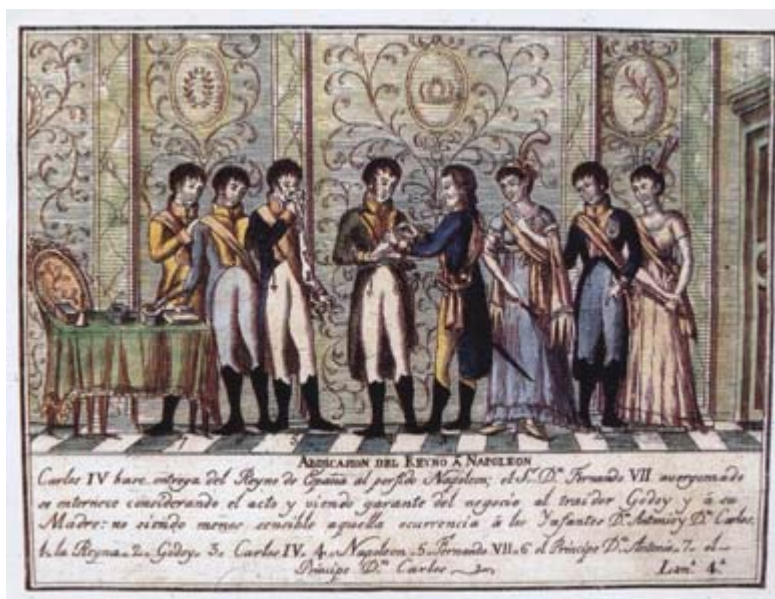
FIGURA 7. Anónimo (1808).

[...] dice a Fernando que no le aceptará jamás por Rey de España. ‘Si hasta la media noche los dos Príncipes no reconocen a su padre legítimo Rey, y no lo comunican así a Madrid, serán tratados como rebeldes’. Al ‘cazorro’, que hasta entonces supo resistir, le falta el corazón y se entrega sin dignidad, trasladando al Emperador copia de la carta que piensa enviar por la mañana a su padre abdicando la Corona, y suplicando al César que le tome bajo su protección, lo mismo que a los otros miembros de su familia. Enseguida revoca los poderes que confirió a la Junta, y aconseja al país que no dé crédito a las exhortaciones de Inglaterra, ‘su eterna enemiga’” (10).