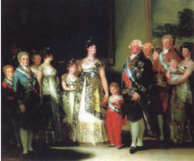
FIGURA 5. La familia de Carlos IV, por Goya.

En la obra El Madrid de los Borbones , de 1985 , se comenta que “Madrid, como toda España, andaba en su gran mayoría contra el favorito, que no contaba sino con muy pocos partidarios, y éstos harto timoratos [...]. Pero había sido Madrid el que pagara, con fondos de su Ayuntamiento, el palacio de Buenavista para regalárselo. [...] Cuando, tras el motín de Aranjuez y la exoneración de Godoy, fueron incautados todos sus bienes, el Estado se quedó bonitamente con el palacio, que había pagado el dinero de los madrileños; lo destinó al Ministerio del Ejército” (15). En relación con este asunto, ya Mesonero Romanos había publicado que Godoy “había sido obsequiado en 1807 por la villa de Madrid con el [palacio] de Buenavista, que adquirió al efecto de los herederos de la Duquesa de Alba, [por un importe total de ] mas de diez millones de reales” (4).