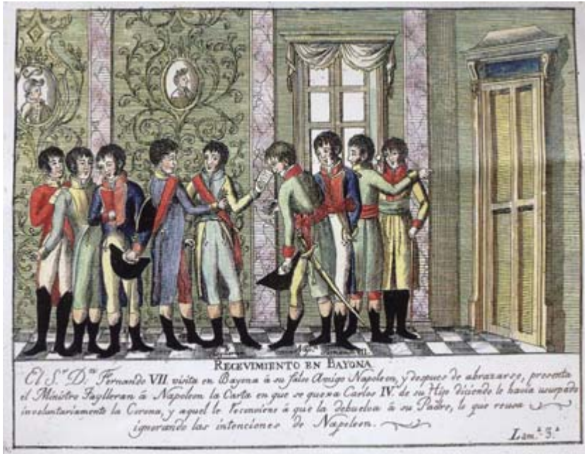
FIGURA 6. Anónimo (1808).

dicional. Llegó á Bayona la noticia de los sucesos de este día, e inmediatamente lo participó Napoleón á los reyes, mandándoles llamar á su hijo para que abdicara pura y simplemente, como lo hizo el 6; mayor fue la flaqueza de su padre, que en la misma tarde hizo la suya, cediendo la Corona de España al mismo Napoleón, estipulando con él un tratado en que sólo se ponían como precisas condiciones la integridad de la monarquía y el mantenimiento de la unidad católica. El 10 renunció Fernando sus derechos como príncipe, señalándole en cambio una pensión, como á los demás infantes, siendo internados en Francia, y destinándose á Fernando el palacio de Valencey” (9).