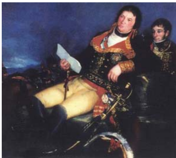
FIGURA 4. Godoy, retratado por Goya en 1801, como Jefe supremo en la “Guerra de las Naranjas”.

Ya en el siglo XX, un conciso Prontuario de Historia de España y de la Civilización Española , del año 1917, resume que “la principal causa de la popularidad del príncipe de Asturias, D. Fernando, era el odio que profesaba á Godoy, y á éste no le quedaba más que el corazón de sus reyes, que no le abandonaron nunca” (9).