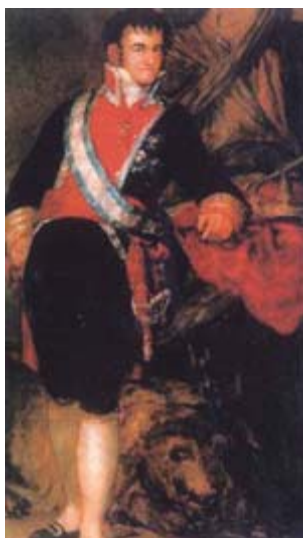
FIGURA 3. Fernando VII, visto por Goya.

clusiva devoción a su esposa, que, combinada con la más ridícula candidez, lo ha hecho siempre ajeno al menor atisbo de sospecha” (1).