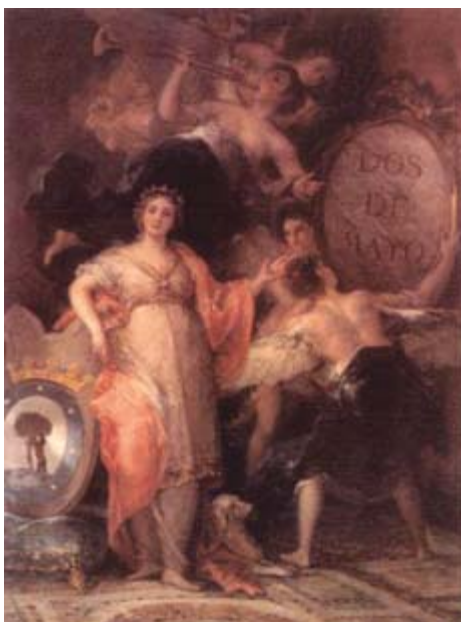
FIGURA 17. Alegoría de la Villa de Madrid. En el fondo, en 1810, había pintado Goya el retrato de José Bonaparte. Sucesivamente se reemplazó por: 'Constitución'; 'José I', 'Constitución', y 'Dos de Mayo' (80).

de los cuales formarían después el núcleo de los juramentados, que colaborarían activa o pasivamente con el nuevo rey impuesto por Napoleón.