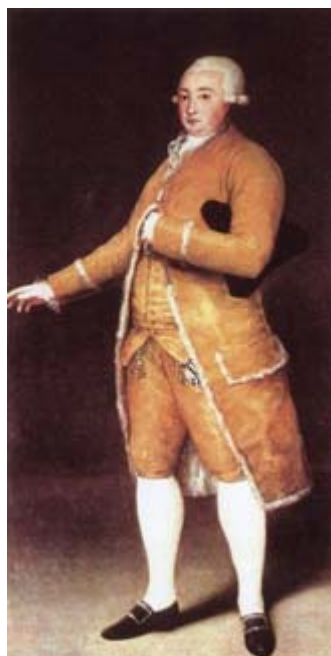
FIGURA 11. Cabarrús, por Goya.

Especialistas tan prestigiosos como Artola o Juretschke han tratado con detalle desde tiempo atrás, y otros como López Tabar más recientemente, así como hispanistas franceses (33, 47-49), el delicado tema de los afrancesados. Juretschke distingue tres grupos entre ellos: 1. o ) El de los que muy temprano (antes de la primavera de 1809) se incorporaron al partido josefino, formado frecuentemente por personas cultas (Cabarrús, etc.) (Figura 11) que “preferían el orden napoleónico a la demagogia revolucionaria, [los cuales] parecen ser más dignos de compasión que de respeto”. 2. o ) El de “aquellos que se dedicaron a colaborar después de la conquista de Andalucía [por los invasores], aproximadamente a los dos años después de haber empezado las hostilidades”, entre los cuales se hallaban famosos literatos y presbíteros que incluso habían ensalzado inicialmente la resistencia frente al invasor (Lista, Miñano, etc.). 3. o ) El de los funcionarios (profesores, militares, administrativos, etc.) y bastantes religiosos que acataron resignados la aparente situación legal. Este último grupo parece ser que resultó muy eficaz para la causa del Intruso, a pesar de que no siempre colaboraran sus componentes de forma activa (37).