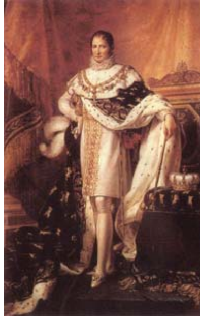
FIGURA 8. Retrato oficial de José Bonaparte como rey de España (por François Gérard, Museo de Fontainebleau).