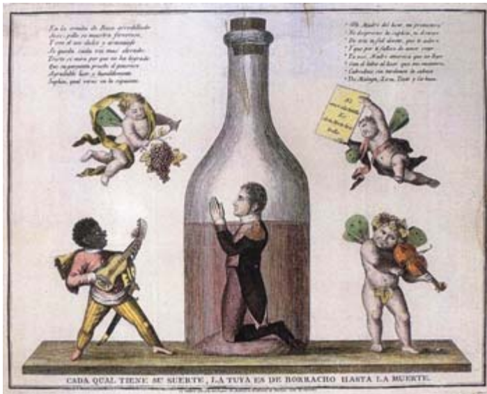
FIGURA 10. Anónimo (1814).