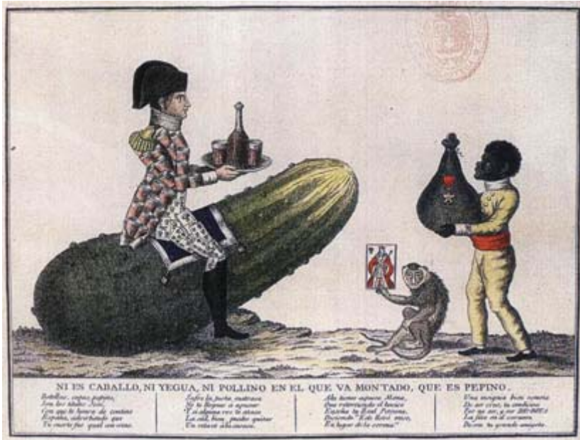
FIGURA 9. Anónimo (1814).