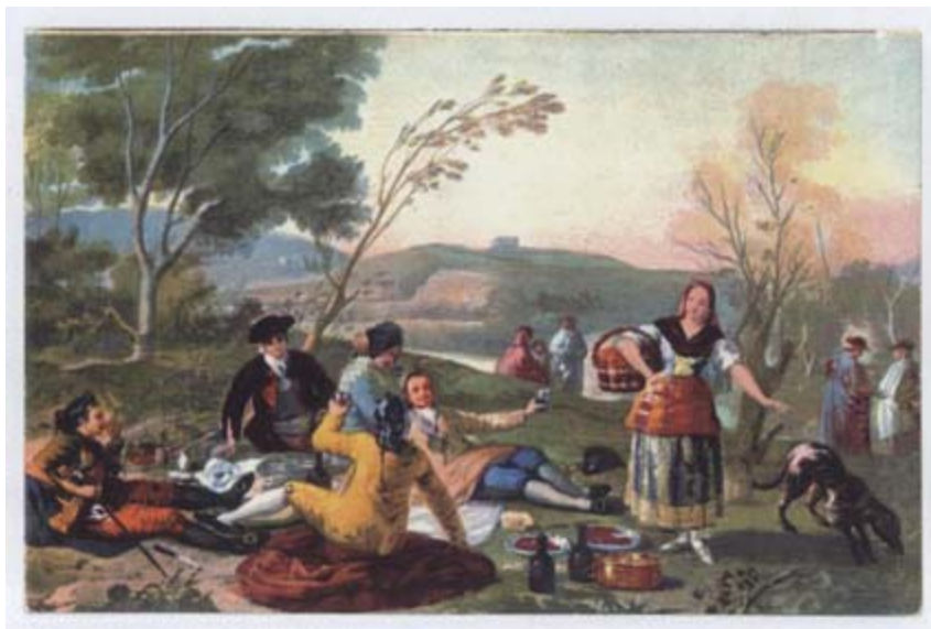
FIGURA 2. Goya: La Merienda a orillas del Manzanares .

había conseguido dismantelar, [entre los que figuraban] Mesta, Inquisición, señoríos, municipios oligárquicos y privilegios estamentales, [mientras] en Europa, el Antiguo Régimen agonizaba, víctima de sus propias contradicciones y estallido de la Revolución francesa” (3).