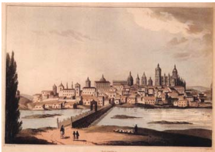
FIGURA 15. Salamanca (1809).